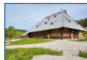
Kienzlerhansenhof Schönwald im Schwarzwald | 1591