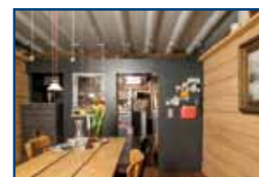
Stadthaus Konstanz | 13.–20. Jh.