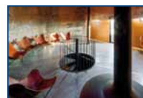
Ehem. Bahnwasserturm Heidelberg | 1920er-Jahre