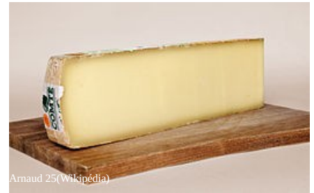
Arnaud 25 (Wikipédia)

Das Morteau Tal und die Franche Comté sind für ihre kulinarischen Spezialitäten weltweit bekannt .